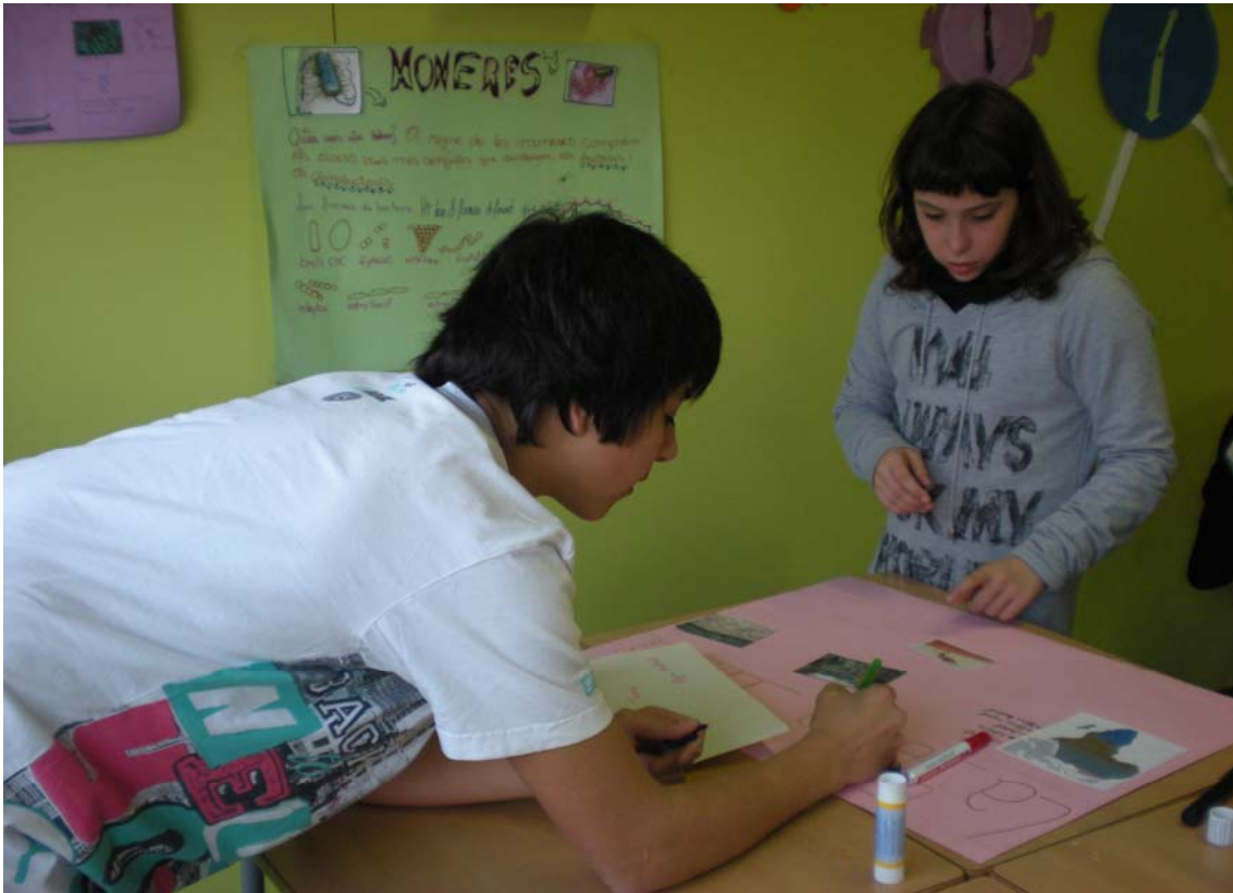
Elaborando los murales para la exposición oral