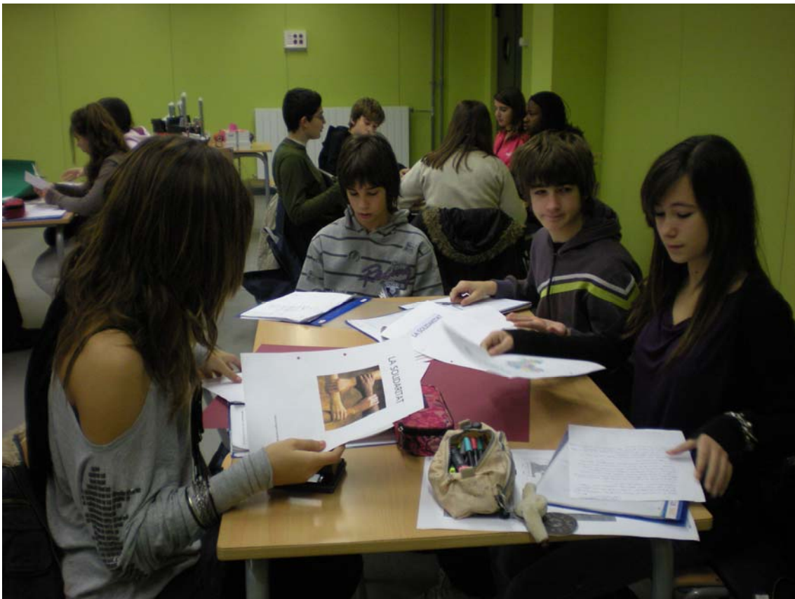
Realizando las actividades del Dossier en grupos cooperativos

Matemáticas: análisis de datos numéricos y elaboración de un gráfico de barras.