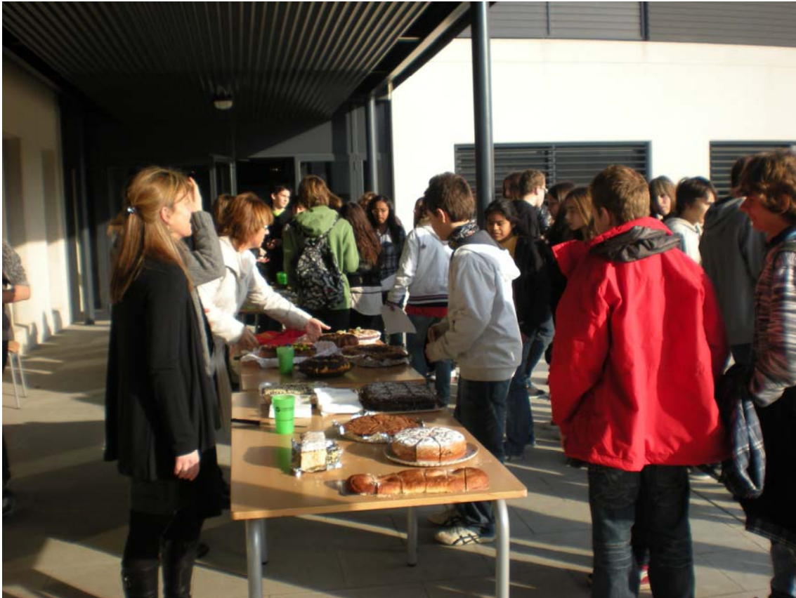
Desayuno solidario para la recogida de fondos para la asociación Dugu (Senegal)